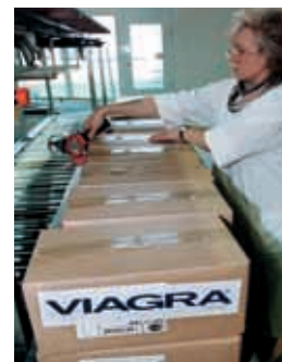
Viagra: Cash-Cow des Pharma-Riesen Pfizer

Krisenfest und trotzdem wachstumsstark: die Vorteile des Gesundheitssektors bringen die Anlagestrategen der meisten Banken dazu, Aktien von Medizinaltechnik- und Pharmafirmen auch in der heutigen Situation zu favorisieren. Zwar haben auch diese Titel unter dem Kurszerfall an den Aktienmärkten gelitten, doch den Top-Firmen der Branche geht es gut. Zudem sind die Geschäftsaussichten weiterhin rosig. Die zunehmende Überalterung in den Industrieländern lässt die Nachfrage weiter steigen. Zudem öffnen sich mit steigenden Volkseinkommen neue Märkte in den Schwellenländern. Besonders lukrativ sind neue Produkte, die die Lebensqualität steigern: von Potenzpillen bis zu Zahnimplantaten.