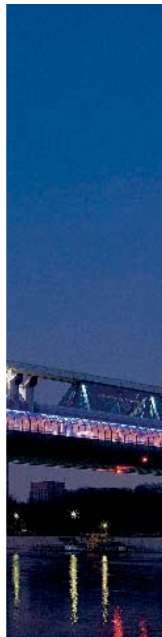
Bauboom in Russland: Futurismus

Während der beste Fonds 35,8 Prozent pro Jahr zulegen konnte, rentierte der schwächste «nur» 14,79 Prozent. Das ist eine Differenz von 20 Pro-