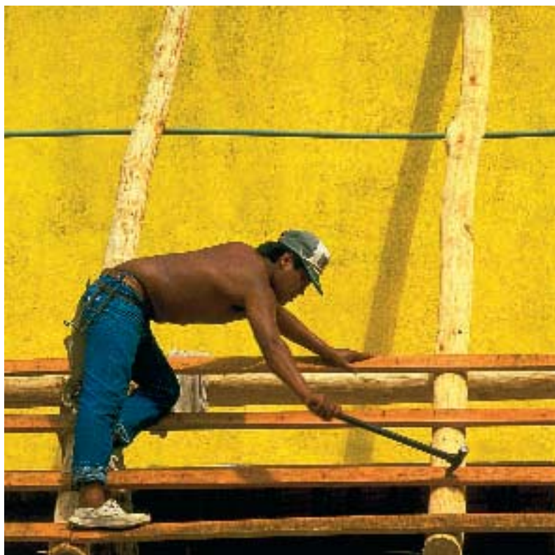
Der Aufschwung beginnt im Schwellenland: Mexikaner an der Arbeit