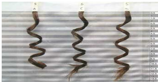
Halt: Je länger die behandelten Haarlocken ihre Form behalten, desto besser die festigende Wirkung des Produkts