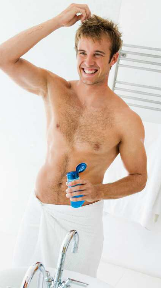
Haargel: Soll Form geben und leicht auswaschbar sein