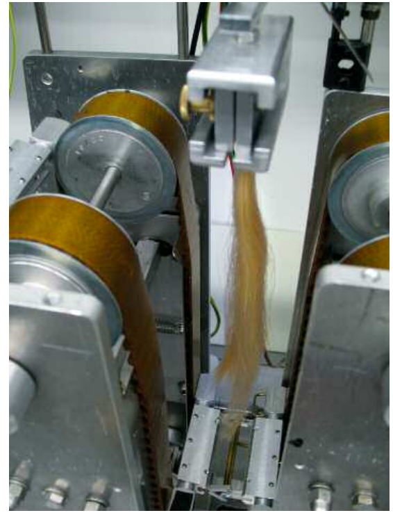
Kämmbarkeit: Je stärker ein Produkt das Haar verklebt, desto mehr Kraft braucht die Maschine zum Kämmen