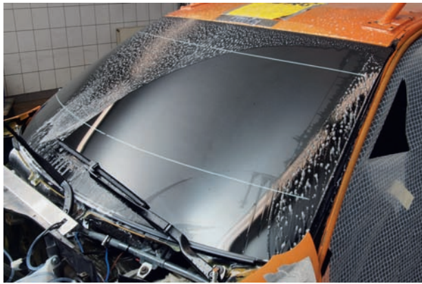
Testsieger: Der Balkenwischer Aerotwin von Bosch schnitt bei allen Testkriterien am besten ab